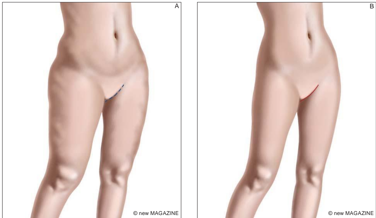
Figura 54. Lifting di cosce con incisione lungo piega inguinale: aspetto pre-operatorio (A) ed aspetto post-operatorio (B).