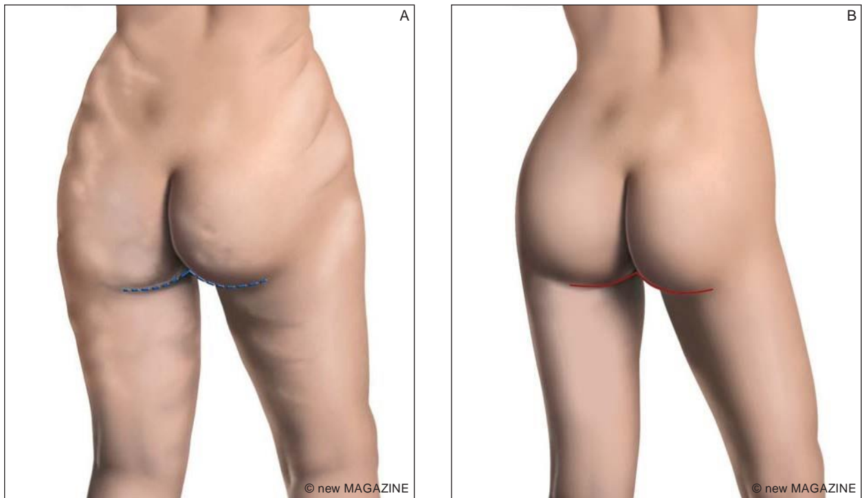
Figura 57. Lifting di cosce con incisione a livello del solco gluteo: aspetto pre-operatorio (A) ed aspetto post-operatorio (B).